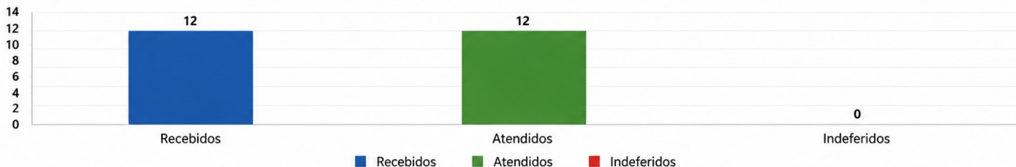
GRÁFICO – QUANTITATIVO DE PEDIDOS

OBSERVAÇÃO: As informações genéricas dos solicitantes são apresentadas de forma agregada, em conformidade com a Lei Geral de Proteção de Dados Pessoais – LGPD (Lei nº 13.709/2018).